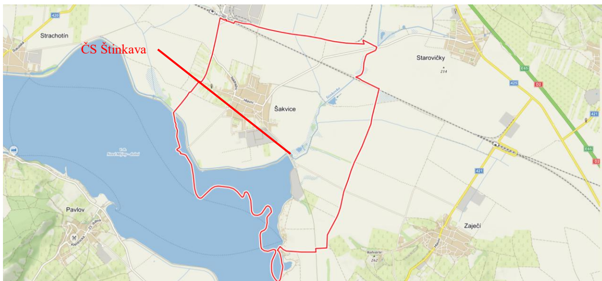
Čerpací stanice Štinkava