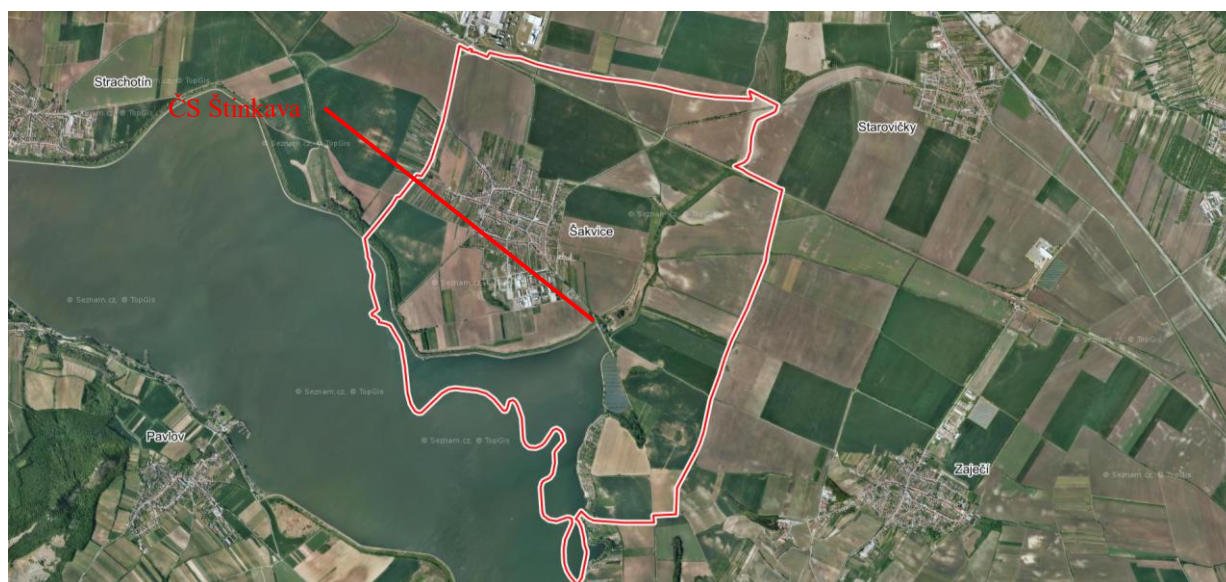
Letecký snímek s označením čerpací stanice Štinkava